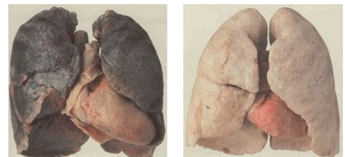
Poumons d'un fumeur Poumons sains (Korperwelten 2005)

Les fabricants ajoutent encore beaucoup d'autres substances, au total pas moins de 599. La plupart d'entre elles sont très toxiques. Ainsi, on y ajoute de l'ammoniac, qui se caractérise par une forte odeur, et qui renforce l'effet dépendant de la nicotine. Dès lors, les fumeurs deviennent très vite dépendants de la cigarette, et vont se mettre à en fumer davantage. Les fabricants voient ainsi leur chiffre d'affaires augmenter.